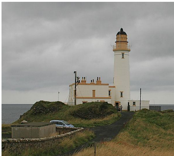
Turnberry Lighthouse ILLW UK0000

Een paar jaar geleden besloot de International Association of Lighthouse Keepers om een jaarlijkse open dag te houden voor vuurtorens over de hele wereld om bezoekers aan te moedigen hun vuurtorens te bezoeken. Ze besloten dat er geen betere dag kon worden besloten dan de zondag van het ILLW. Deze stap is zeer succesvol geweest, aangezien de media in een groot aantal van de bij het evenement betrokken landen betrokken zijn geraakt.