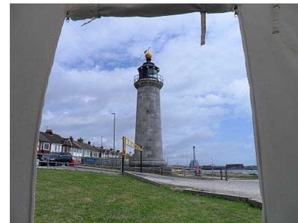
Shoreham Lighthouse, Southern England.

00.01UTC 21 August 2021 to 2400UTC 22 August 2021 (48 hours)